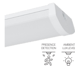
RGL MAXI INTELLIGENT