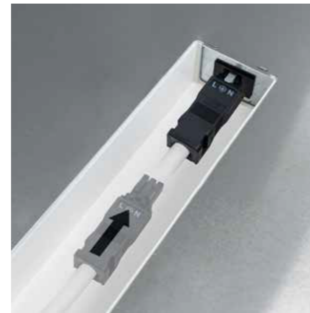
L'installazione degli apparecchi è immediata grazie al pratico connettore situato nel dorso.