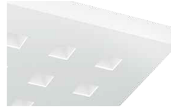
Versione PC corpo-diffusore in ABS satinato con diffusore effetto CUT-OFF per il controllo dell'abbagliamento.