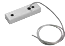
00AA165P Rosone di alimentazione a 5 poli lunghezza cavo 2000mm.