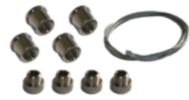
48AA1330 Kit sospensione con regolazione millimetrica 3000mm.